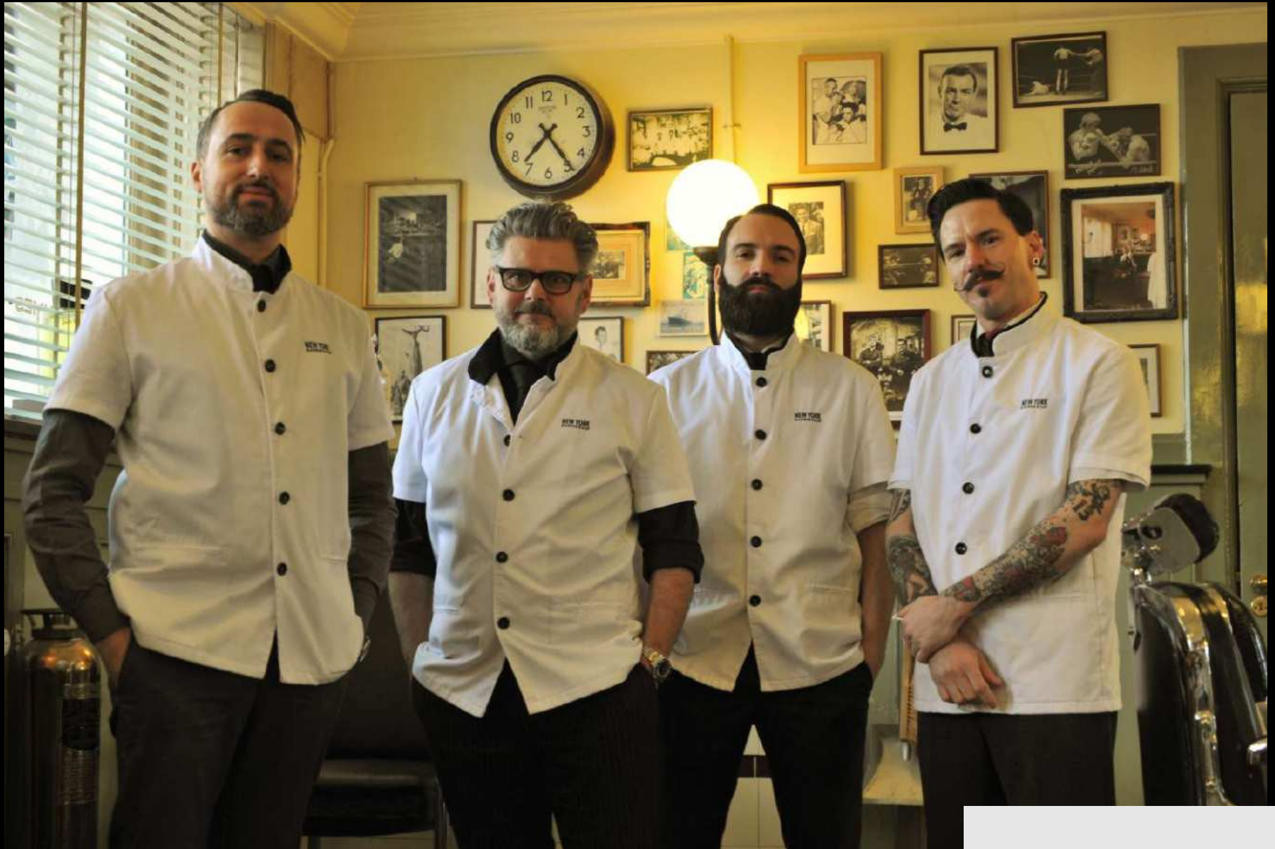
NEW YORK BARBERSHOP, ROTTERDAM, 2014