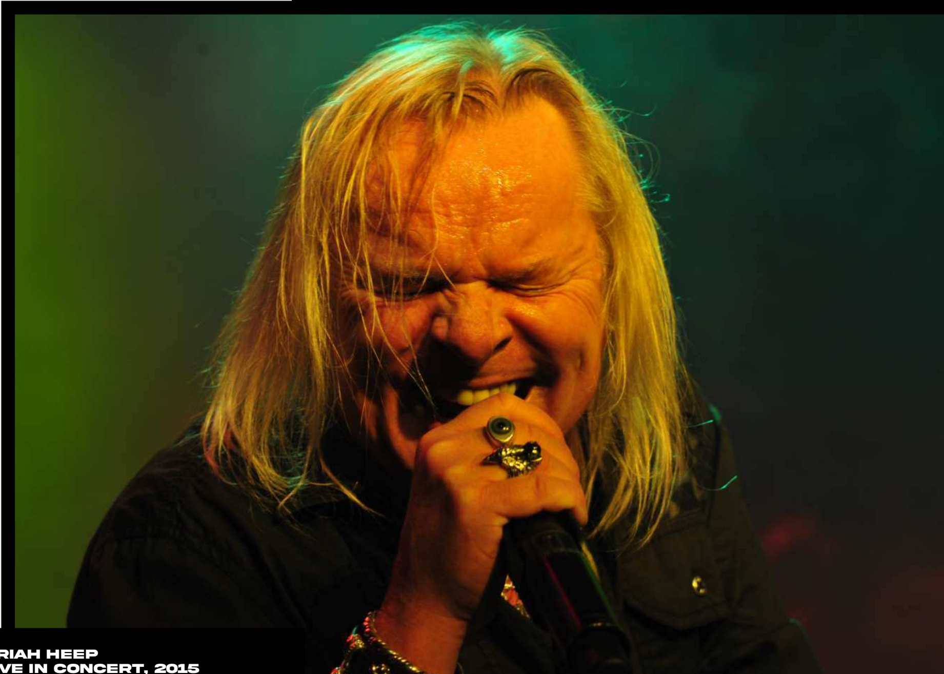
URIAH HEEP LIVE IN CONCERT, 2015