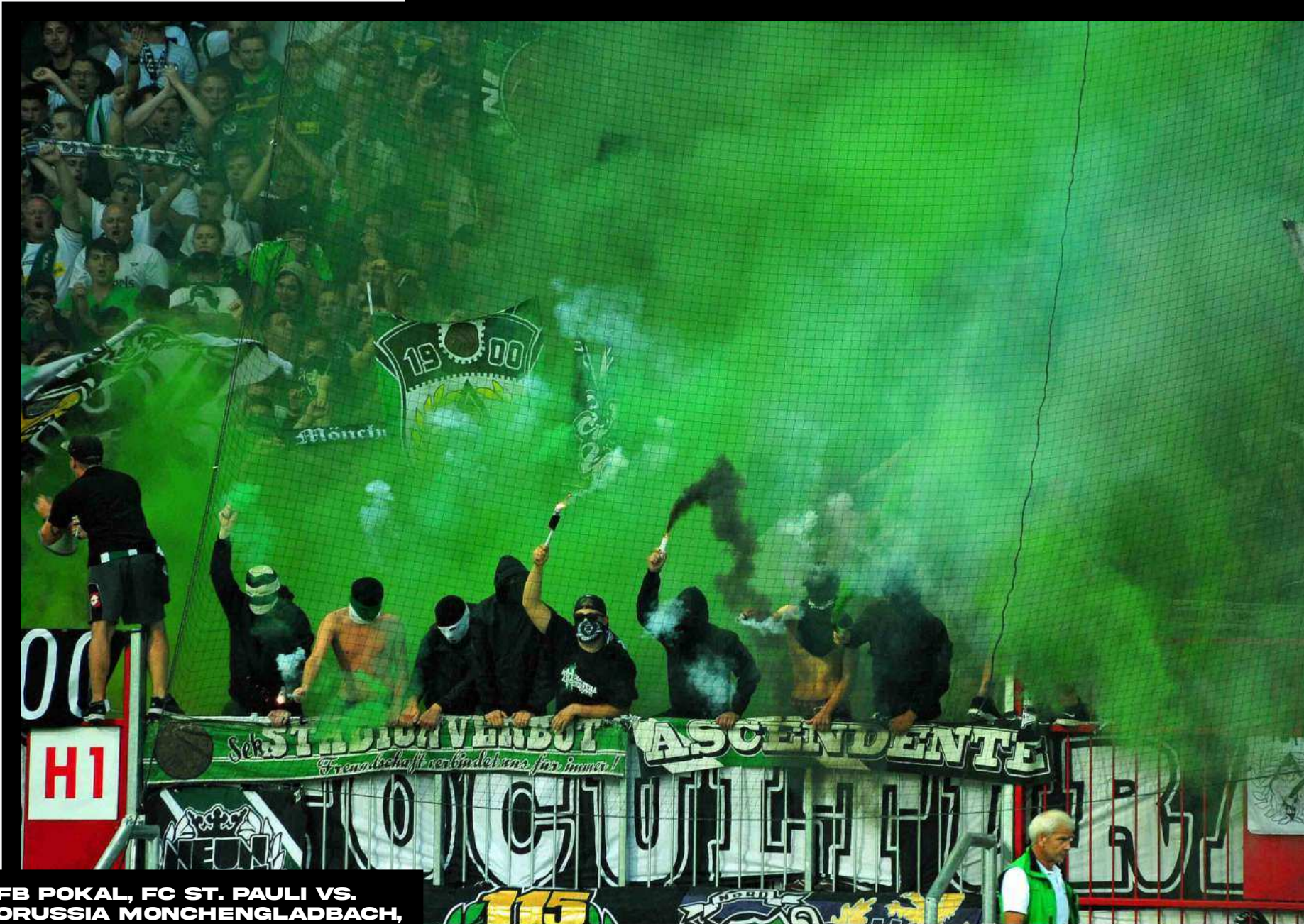
DFB POKAL, FC ST. PAULI VS. BORUSSIA MÖNCHENGLADBACH, HAMBURG, 2015