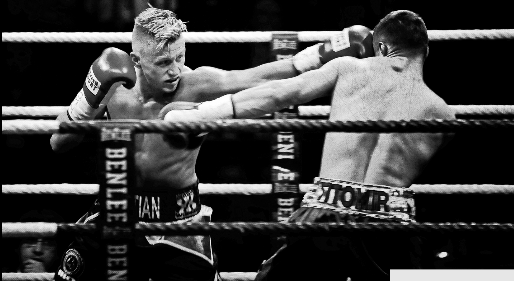
SUPERWELTERWEIGHT, IBO CONTINENTLE TITLE, HAMBURG, 2017