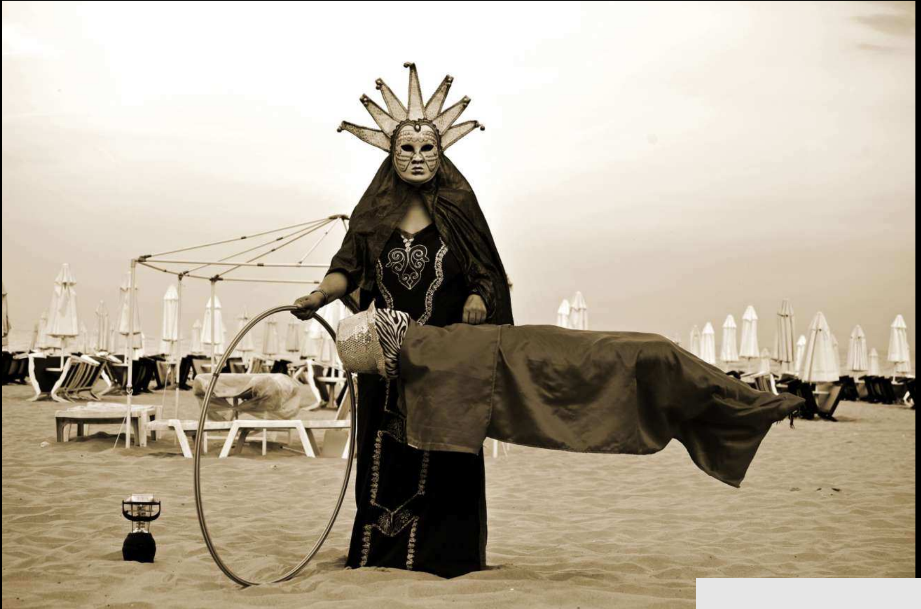
STREET ART, BULGARIA, 2013