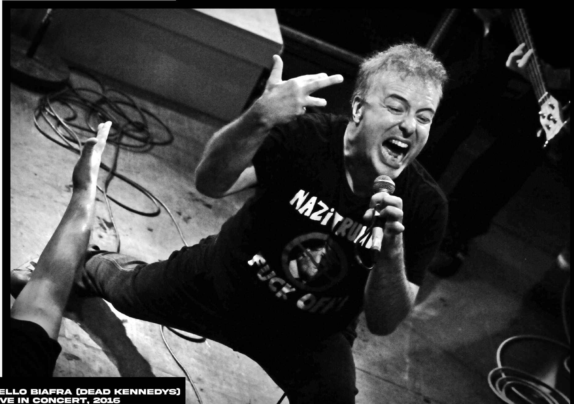
JELLO BIAFRA (DEAD KENNEDYS) LIVE IN CONCERT, 2016